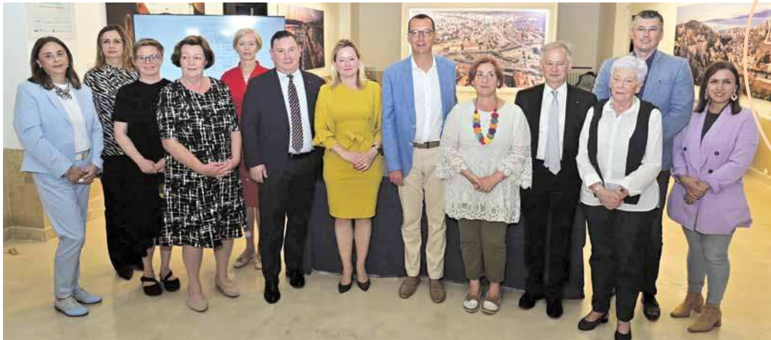
Una foto ricordo dei presenti