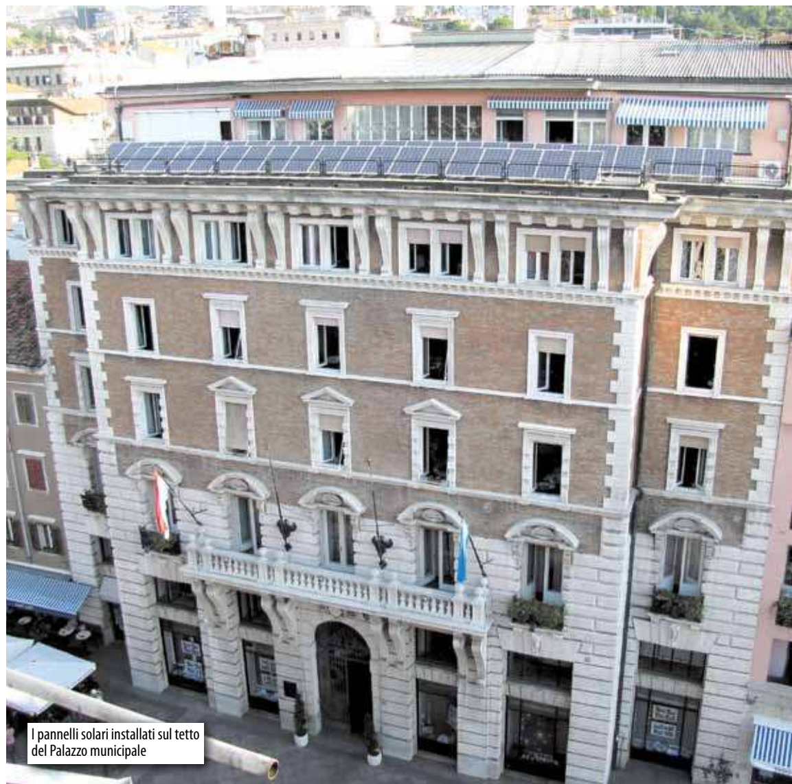
I pannelli solari installati sul tetto del Palazzo municipale