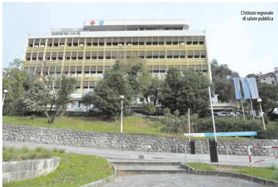
L'Istituto regionale di salute pubblica

Negli ultimi tre anni, dal bilancio della Città di Fiume sono stati stanziati circa 3.683.000 euro per programmi e progetti nel campo della sanità e della protezione sociale attuati da istituzioni e associazioni (inclusa la Croce Rossa della Città di Fiume).