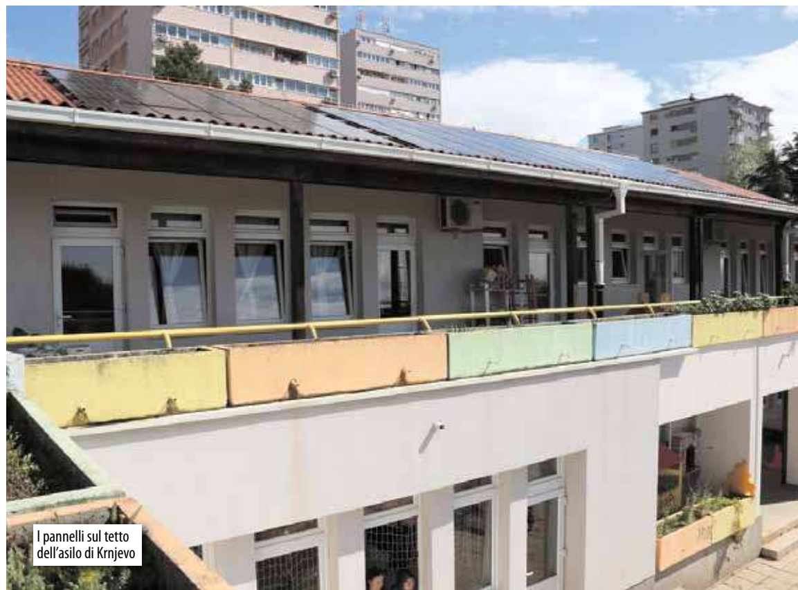
I pannelli sul tetto dell'asilo di Krnjevo

Inoltre, la Città ha installato pannelli solari per la produzione di acqua calda sanitaria negli asili Potok, Mavrica, Morčić e Đurđice, che consumano più energia a causa delle cucine centralizzate o delle lavanderie in essi presenti. Fino ad oggi sono stati prodotti quasi 900 MWh di energia elettrica dall'energia solare.