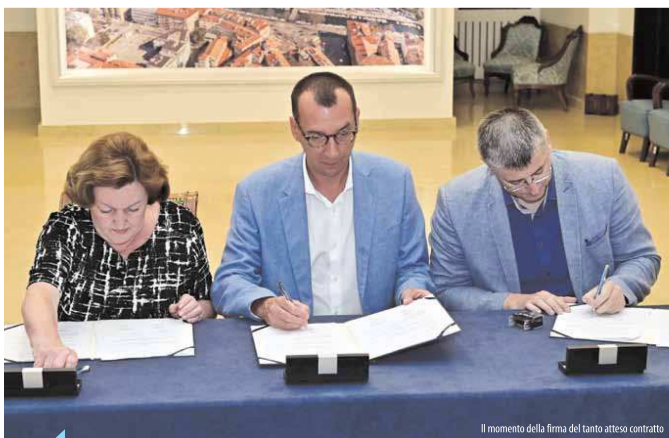
Il momento della firma del tanto atteso contratto