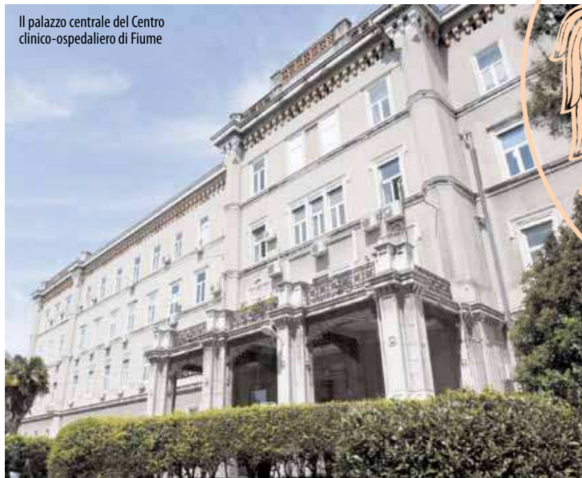
Il palazzo centrale del Centro clinico-ospedaliero di Fiume

Per il 2024, la Città di Fiume ha allocato 667.300 euro per i progetti delle associazioni e delle comunità religiose nel campo dell'assistenza sociale e sanitaria