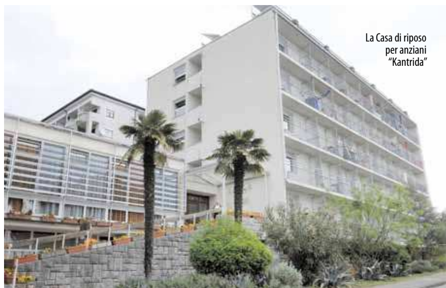
La Casa di riposo per anziani "Kantrida"

P er i progetti e programmi nel campo della sanità, della tutela sociale e del miglioramento della qualità della vita per il 2024, attuati da associazioni e comunità religiose, la Città di Fiume ha stanziato 667.300 euro. Si tratta di programmi e progetti di associazioni e comunità religiose selezionati tramite un bando pubblico annuale, la cui scadenza per la presentazione delle domande era il 1° marzo. Al bando pubblico sono pervenute complessivamente 80 domande, di cui dieci non hanno soddisfatto le condizioni formali prescritte dal bando, mentre sono stati selezionati per il cofinanziamento 61 programmi e progetti. Sulla base dei risultati del bando, la Città di Fiume sosterrà programmi e progetti nei settori della tutela sociale; della tutela della salute fisica e mentale; della cura degli animali e del miglioramento della qualità della vita. La Città di Fiume continua a sostenere una serie di progetti e programmi di lunga data e riconosciuti, le cui categorie target sono bambini, giovani (soprattutto quelli a rischio di povertà e/o esclusione sociale), donne, famiglie, anziani, bambini con disabilità, persone con disabilità, vittime di violenza, senzatetto, utenti di alloggi di emergenza, tossicodipendenti, veterani, vittime di guerra, persone gravemente malate e croniche, consumatori, cittadini in generale e animali. L'obiettivo del bando pubblico è migliorare la qualità della vita dei cittadini, proteggere e