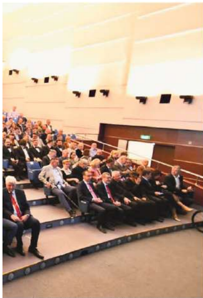
All'HKD di Sušak è intervenuto il pubblico delle grandi occasioni