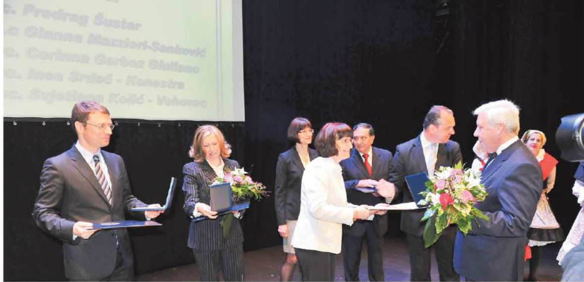
Il momento della consegna dei premi ai fautori del Dipartimento di Italianistica della Facoltà di Lettere e Filosofia di Fiume