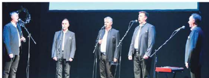
La klapa Vinčace ha eseguito l'inno nazionale