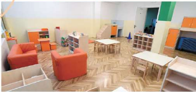
Nuovi spazi asilo attrezzati per ospitare altri 64 bambini