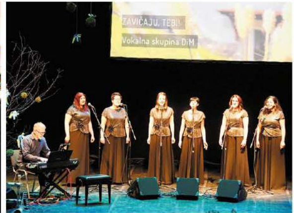
Il gruppo vocale DiM