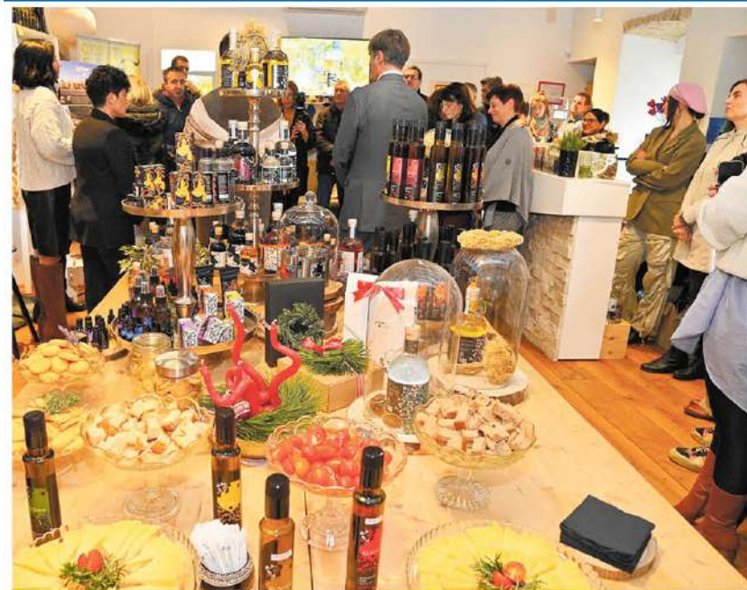
La presentazione nella Cassetta litoraneo-montana