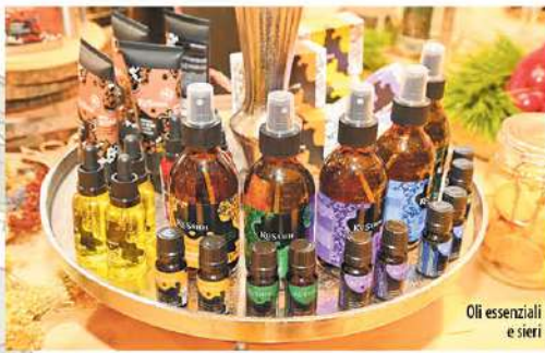
Oli essenziali e sieri