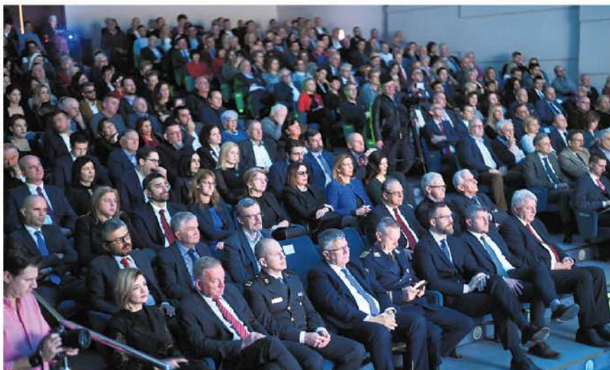
La sala dell'HKD di Sušak piena in ogni ordine di posti

Nel suo discorso il presidente Komadina ha sottolineato che la Regione litoraneo-montana continua a essere una delle più sviluppate a livello nazionale e che il 2023 – nel corso del quale la Croazia ha completato il suo percorso d'integrazione europea con l'adesione all'Eurozona e allo Spazio Schengen – ha portato con sé numerose sfide che sono state superate con successo. "Siamo giunti alla fine di un altro anno impegnativo nel quale, a 10 anni dall'adesione all'Unione europea, siamo entrati con ottimismo come membri a pieno titolo e pienamente integrati a livello comunitario", ha detto Komadina. "Abbiamo già dimostrato di poter affrontare