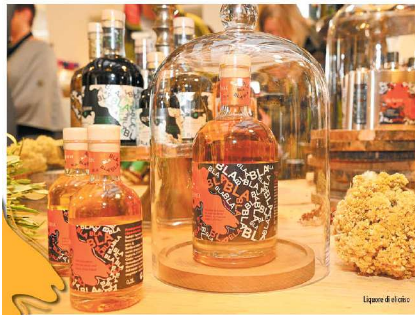
Liquore di eliciso