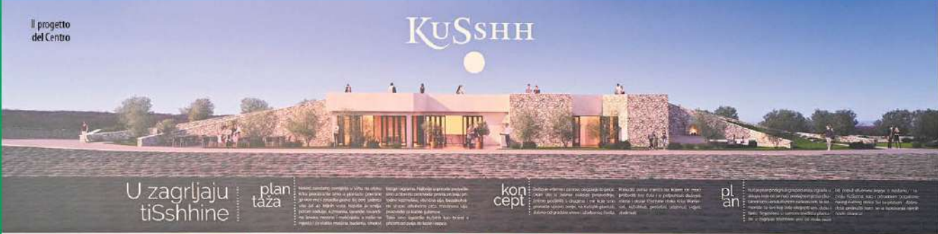
Il progetto del Centro