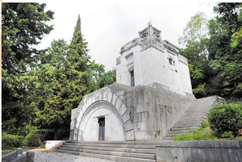
Il mausoleo della famiglia Whitehead

Publicato il bando di concorso per il cofinanziamento del restauro e del rinnovo delle tombe che si trovano nell'area culturale e storica sotto tutela dei cimiteri di Cosala e Tersatto