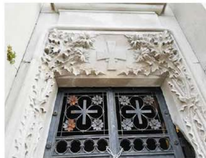
Le decorazioni floreali all'ingresso della cappella mortuaria di Whitehead

Publicato il bando di concorso per il cofinanziamento del restauro e del rinnovo delle tombe che si trovano nell'area culturale e storica sotto tutela dei cimiteri di Cosala e Tersatto