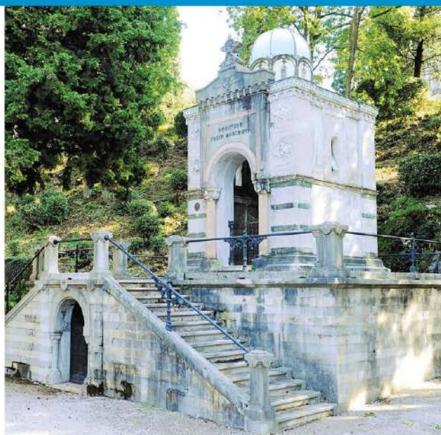
Il mausoleo Gorup nel cimitero monumentale di Cosala

I proprietari delle tombe nei cimiteri di Cosala e Tersatto hanno tempo fino al 27 settembre prossimo per presentare la domanda per il cofinanziamento del restauro e del rinnovamento delle tombe nel 2023. In particolare, il Dipartimento amministrativo per l'educazione, la cultura, lo sport e la gioventù della Città di Fiume ha pubblicato un invito pubblico agli utenti delle tombe nei cimiteri di Cosala e Tersatto per l'utilizzo dei fondi derivanti dalla tassa sui monumenti, destinati appunto al cofinanziamento del programma di restauro e rinnovamento delle tombe nei cimiteri di Cosala e Tersatto nel 2024.