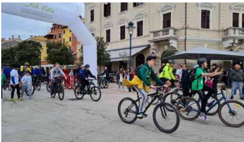
Tutti in sella...