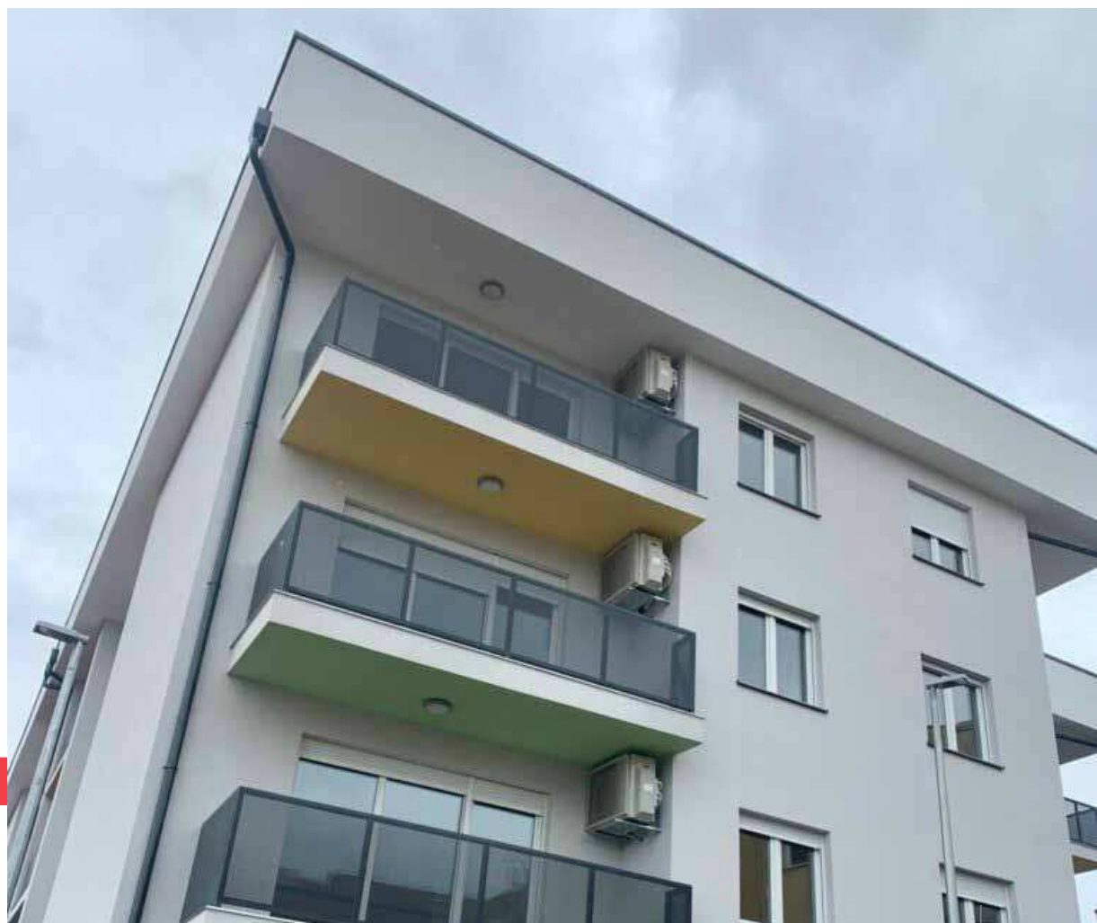
I nuovi condomini