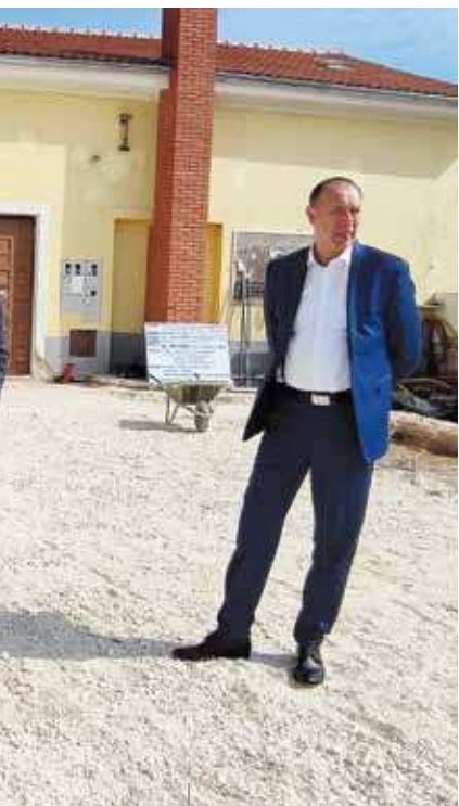
I lavori eseguiti in piazza Laginja