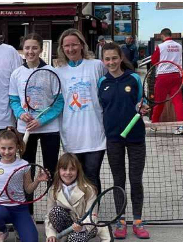
I giovani tennisti della società Sunny hanno dimostrato le proprie abilità

L'evento - intitolato in onore di Rovigno, che in tempi più remoti, era nota come la "Popolana del mare" - è stato avviato nel 2007 su iniziativa dell'Unione sportiva e coinvolge ogni anno turisti e cittadini appartenenti a tutte le fasce d'età.