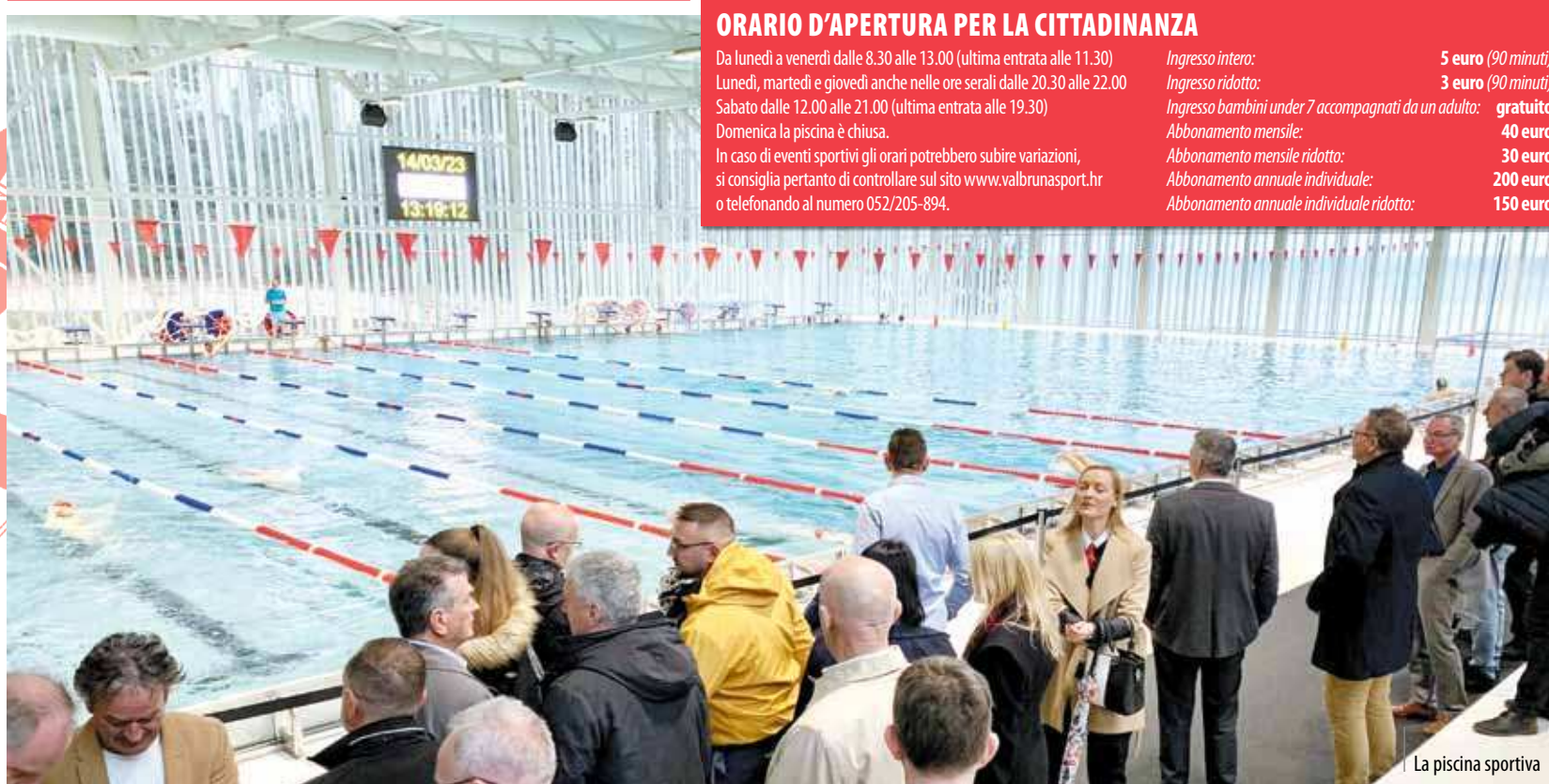
La piscina sportiva