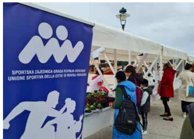
Con una donazione è stato possibile acquistare magliette e fiori