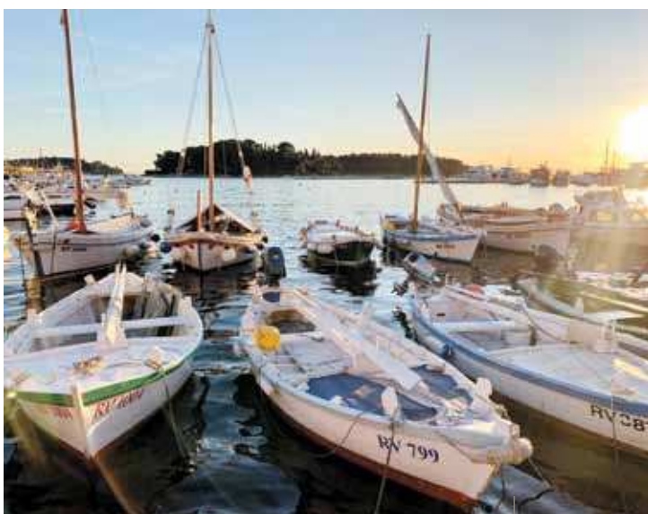
Le batane nel porto

Domenica in mattinata, si svolgerà la parte agonistica della manifestazione, ovvero la Regata. Il mare rovignese diventerà la cornice perfetta per tutti i regatanti che dimostreranno la loro abilità di veleggiare con vele al terzo e latine, mentre nel pomeriggio seguiranno le premiazioni. Un programma d'intrattenimento sarà organizzato entrambe le serate sul veliero “Tartana” che da Pola attraccherà sul molo grande rovignese. Verranno inoltre organizzati in seno alla Regata laboratori creativi per bambini e adulti, dedicati all'usanza di dipingere e decorare le vele, dando vita a una vera e propria... araldica del mare. (ru)