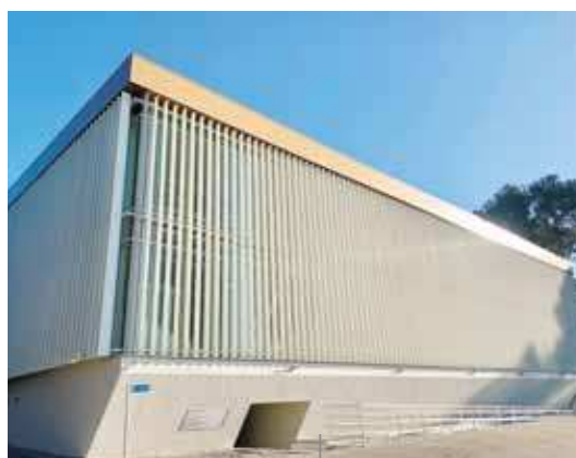
Il moderno complesso di piscine

"Sono orgoglioso di annunciare che grazie a una collaborazione sinergica - ha detto il direttore