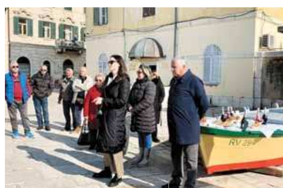
Un momento della celebrazione

La 17ª edizione della Regata, si svolgerà quest'anno nelle giornate del 10 e del 11 giugno e vedrà partecipi più di quaranta imbarcazioni storiche tipiche dell'Alto Adriatico,