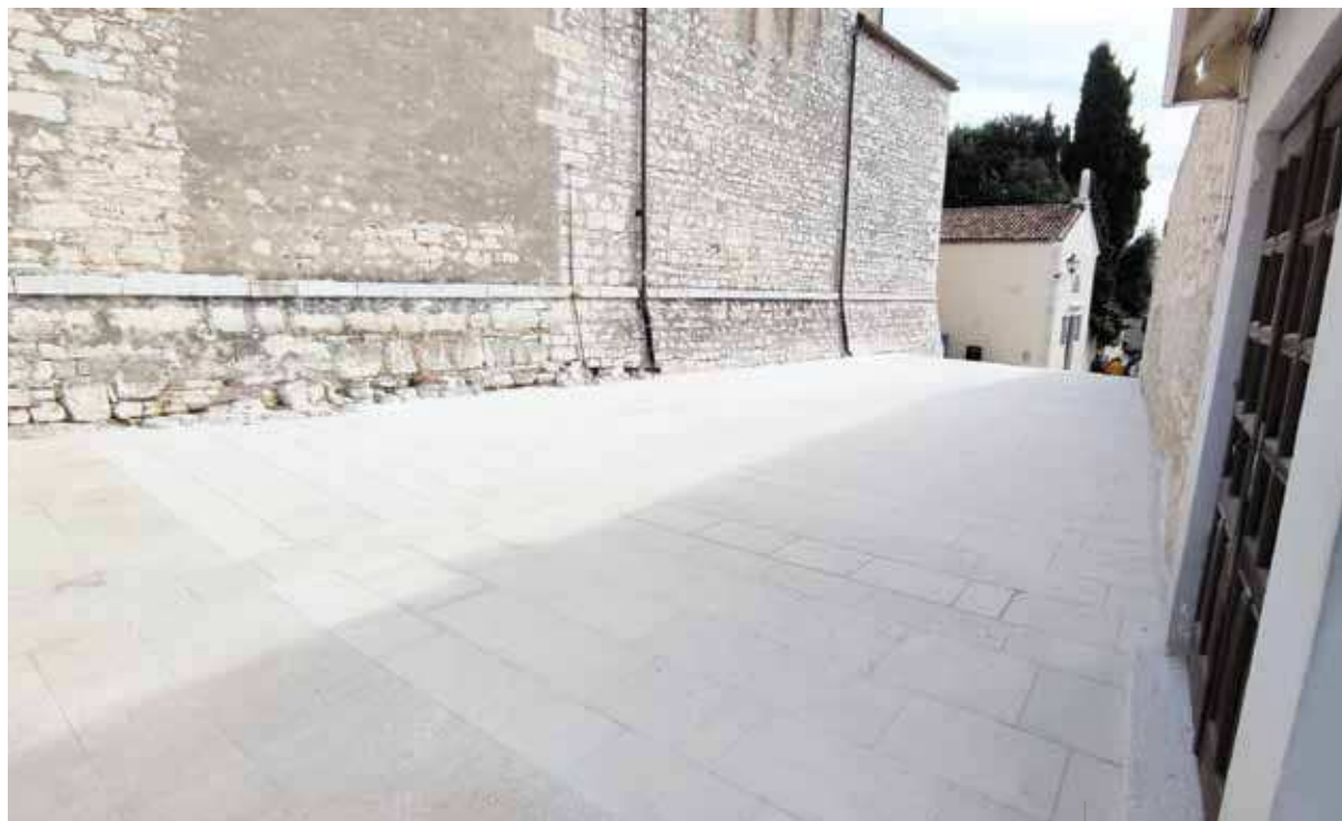
Il nuovo sagrato verso via Grisia