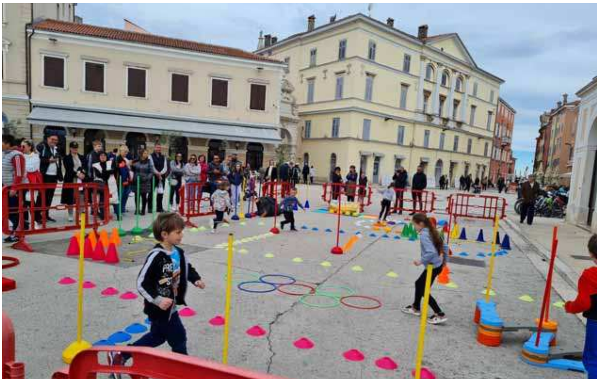
Per i più giovani è stata una giornata all'insegna del divertimento