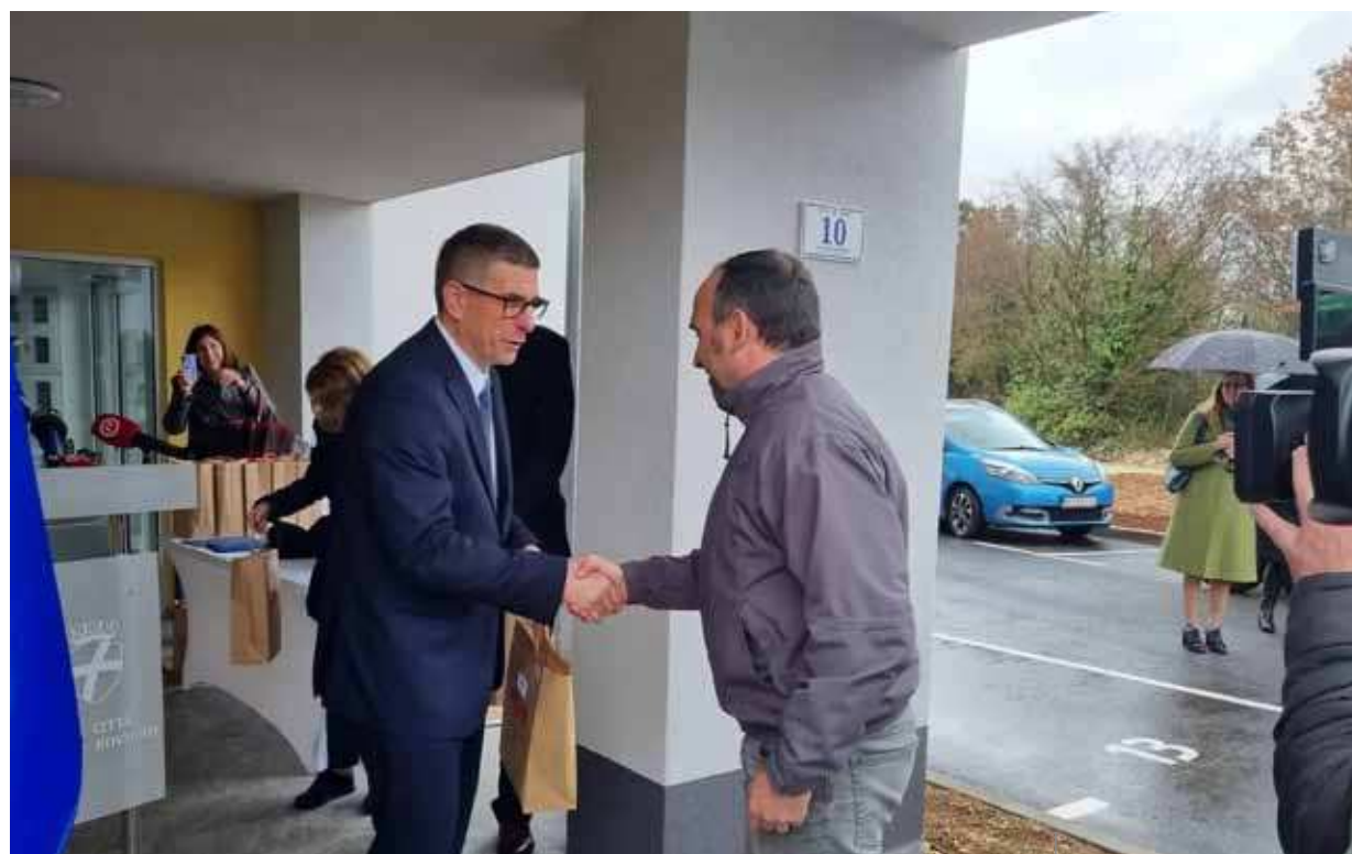
Chiavi in mano a uno degli acquirenti

Il direttore dell'Agenzia nazionale per la gestione degli immobili Dragan Hristov, ha voluto ripercorrere le tappe dell'edificazione degli stabili, iniziata nel settembre 2021, a quando risale la posa della prima pietra. Gli alloggi sono stati acquistati a 1.350 euro al metro quadrato, un prezzo molto più accessibile rispetto ai prezzi di mercato degli alloggi residenziali dell'area cittadina. Ogni edificio dispone di 14 appartamenti, con una superficie utile di circa 2.000 metri quadrati, compresi i posti auto e i ripostigli. Il valore totale dell'investimento è stato di 24