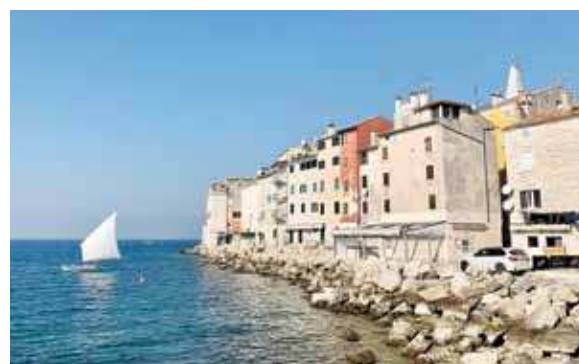
Una batana a vela spiegata

provenienti dall'Istria e dal Quarnero, dall'Italia e dalla Slovenia.