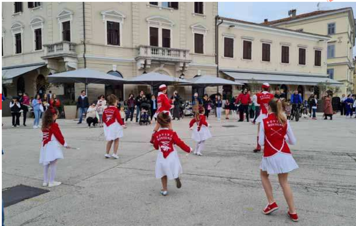
Le majorette si esibiscono in piazza Tito