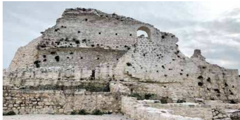
Monte della Torre: resti della fortezza medievale

Il mese scorso si sono conclusi i lavori di restauro e sistemazione del sagrato della chiesa di Sant'Eufemia, uno degli investimenti più importanti eseguiti negli ultimi anni nel nucleo storico cittadino. La Città aveva avviato il progetto di restauro della pavimentazione circostante la chiesa nel 2018, dividendo i lavori in tre fasi. I lavori sono stati avviati lo scorso autunno e hanno compreso lo smantellamento e il restauro della pavimentazione e della scalinata sul lato verso la Grisia, dove sono state riportate alla luce antiche sepolture, databili tra l'XI e il periodo a cavallo tra il XVIII e il XIX secolo. Nella prima fase era stata riassetata la parte occidentale del sagrato, mentre nel 2021 quella meridionale, risultata estremamente ricca di reperti archeologici, tra i quali spiccano i resti interrati della chiesa di San Michele Arcangelo e numerose tombe. In futuro è prevista la posa della pavimentazione sulla parte settentrionale del sagrato, nonché l'installazione di un nuovo impianto di illuminazione. La prossima fase prevede il riassetto della parte settentrionale del sagrato del Duomo, nonché l'impianto d'illuminazione. Fin da subito era chiaro che si trattava di un progetto complesso, essendo l'area iscritta nel Registro dei beni culturali della Repubblica di Croazia, viste le sue peculiarità archeologiche, storiche e architettoniche. Il valore dell'investimento nella terza fase ammonta a poco meno di 235mila euro. Le