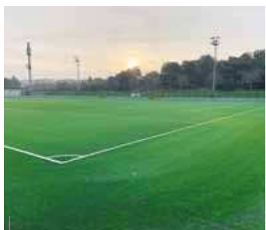
Il manto erboso del campo ausiliario del Valbruna

I fondi erogati dal Ministero del Turismo e dello Sport, oltre a quelli stanziati dalla Città di Rovigno e dal suo Ente turistico, hanno reso possibile il riassetto del campo ausiliario del Valbruna, che ha visto il rinnovo del manto in erba sintetica. Si tratta di un investimento pari a 330mila euro, portato a termine a inizio gennaio dalle maestranze della ditta "Maxmar grupa" di Klinča Sela, con la supervisione della società "Karoline-klng" di Lič. Per il manto in erba sintetica nuovo è stato ottenuto il certificato d'eccellenza FIFA Quality Program, motivo di vanto dal 2009 per il precedente campo di calcio, il che garantisce l'altissima qualità che distingue da anni il Valbruna.