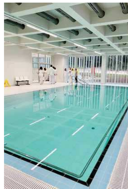
La piscina terapeutica

Il sindaco di Rovigno, Marko Paliaga ha sottolineato il fatto che la realizzazione di questo progetto strategico è la realizzazione di un sogno per l'intera cittadinanza, atteso per più di cinquant'anni, ma anche un lascito importante per le generazioni future di sportivi, oltre che a essere un centro per lo sviluppo di un'assistenza sanitaria di alto livello. "Nonostante le numerose sfide affrontate durante le fasi di costruzione e l'aumento dei prezzi del materiale edilizio, l'investimento è stato portato a termine con successo anche grazie al sostegno della Regione istriana, in qualità di fondatore dell'istituzione e di tutti i Comuni e le Città dell'Istria. La posizione scelta per la realizzazione del progetto del complesso delle piscine si è dimostrata una scelta