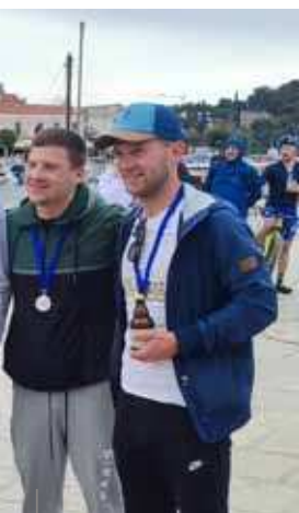
I vincitori della corsa a staffetta