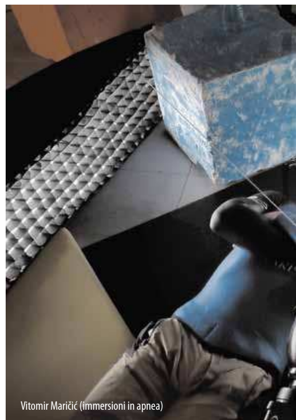
Vitimir Maričić (immersioni in apnea)