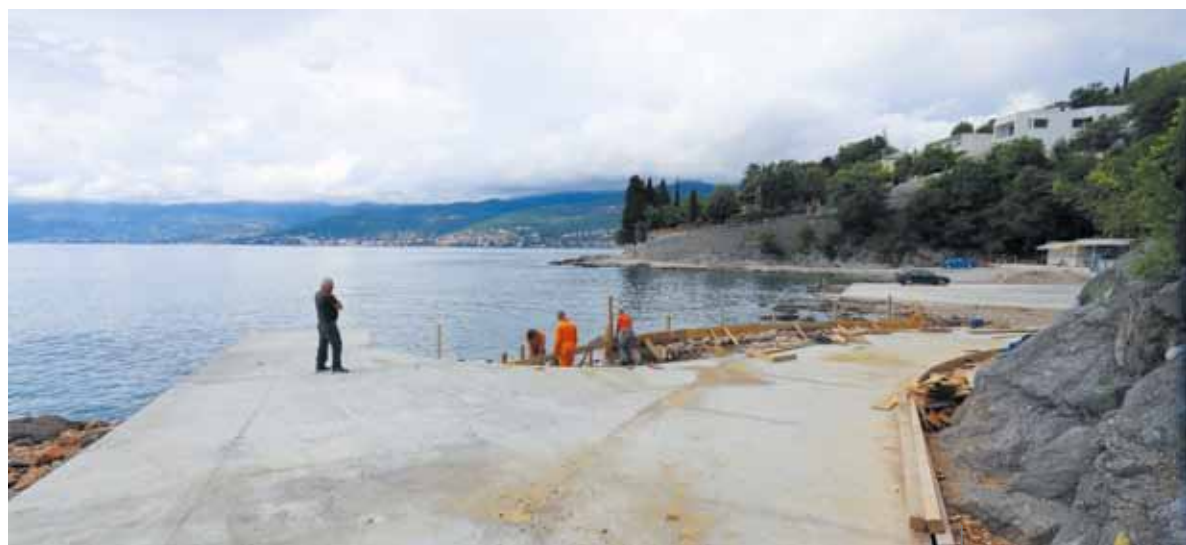
I lavori sul lungomare in Bivio

del valore di 1,7 miliardi di kune – che consenta l'allacciamento di tutti gli utenti sul territorio della Città di Fiume alla rete fognaria, contribuirà indubbiamente a un ulteriore miglioramento della qualità del mare su tutte le spiagge del comprensorio. Per concludere, a giudicare dai contratti di concessione fin qui stipulati, la qualità dell'offerta degli impianti di ristorazione, dei contenuti sportivorecreativi dovrebbe mantenersi sui livelli dello scorso anno.