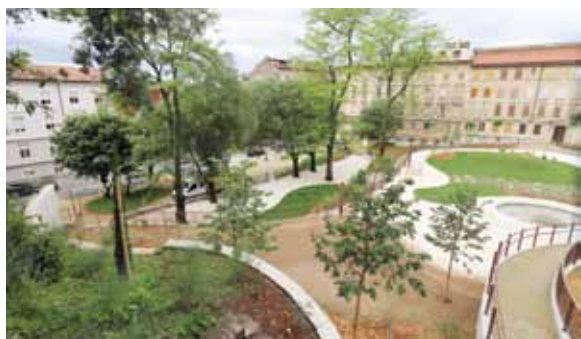
La vegetazione del parco

La Biblioteca civica di Fiume conta 20.091 soci ordinari, dei quali 5.020 (addirittura un quarto!) sono bambini. Quella di Fiume, rientra perciò nel novero delle biblioteche che possono vantare un aumento del numero dei soci (ben l'11% dal 2015). La Biblioteca civica opera attraverso una rete di sezioni (Sezione centrale - Filodrammatica e Palazzo Modello, Sala di lettura, Sezione per ragazzi Stribor), sezioni periferiche (Tersatto, Zamet, Drenova e Torretta), bibliobus (cittadino e regionale) e due biblioteche nei comuni circostanti (Biblioteca di Čavle e Biblioteca di Castelmuschio). I programmi per ragazzi sono legati principalmente alla Sezione per ragazzi Stribor e alle sezioni periferiche, in modo particolare, nell'ultimo anno, a quella di Tersatto.