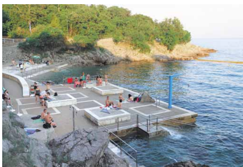
La spiaggia per disabili Kostanj

due basamenti per le docce e i teloni per gli spogliatoi da spiaggia. Tra gli investimenti più consistenti potremmo menzionare la seconda fase dei lavori all'area prendisole in Bivio. Sono state ristrutturare le parti centrale e occidentale della spiaggia, la parte sconnessa dell'area prendisole, i sentieri e il plateau, nonché sono stati costruiti un nuovo basamento per la doccia e i gradini per l'ingresso a mare. Nel punto in cui c'era lo scivolo è stato costruito un nuovo piccolo molo. Negli ultimi due anni, in questa spiaggia sono stati investiti 1,3 milioni di kune.