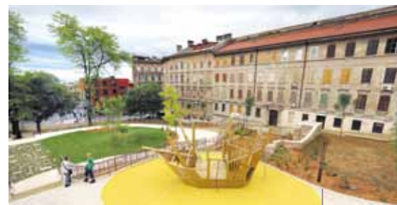
Il parco giochi

sato di adeguare le pendenze ai disabili, installando anche recinzioni di sicurezza. Il parco assumerà certamente un fascino aggiuntivo quando le piante e gli alberi messi a dimora cresceranno. Durante l’allestimento del parco sono stati eseguiti anche lavori alle infrastrutture, che comprendono la costruzione di una nuova cabina di trasformazione, l’installazione degli impianti elettrici, nonché gli allacciamenti alle reti idrica e fognaria. All’interno del Parco Pomerio ci sono anche i servizi igienici adattati ai disabili, l’illuminazione, un sistema di videosorveglianza e i cestini per i rifiuti. In via Pomerio, inoltre, è stata