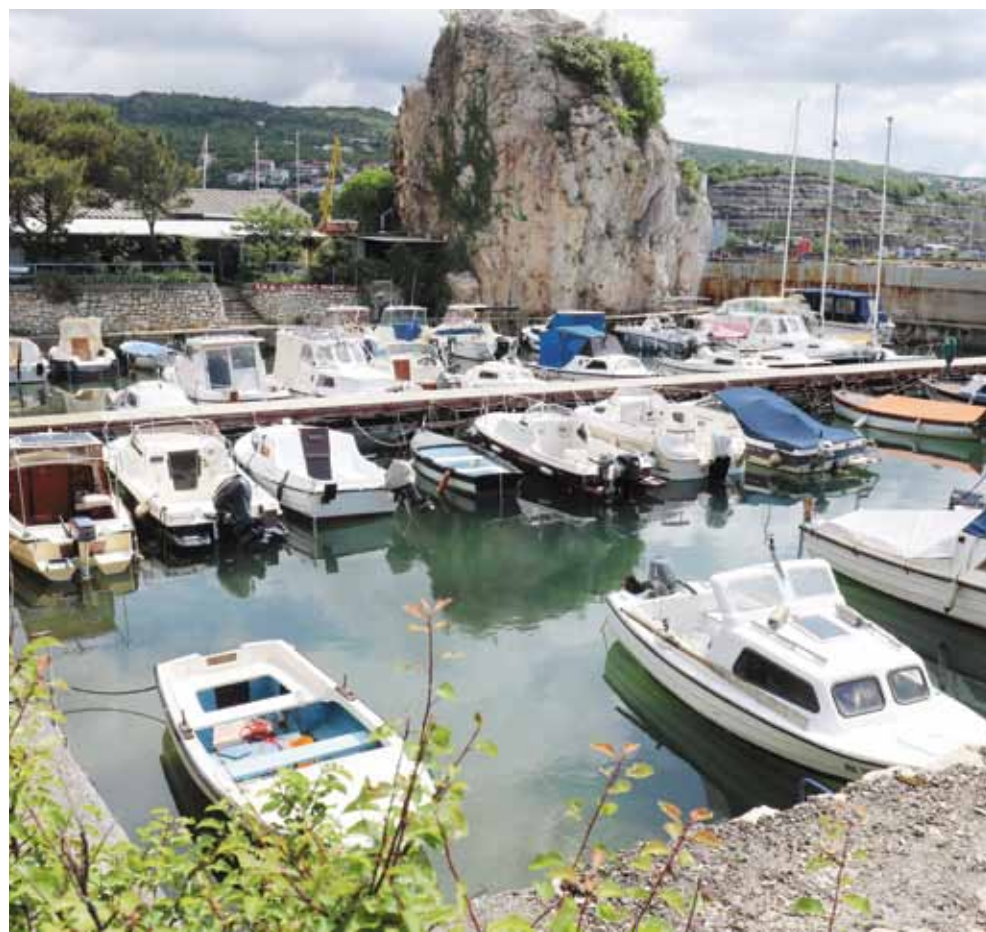
Il porticciolo nei pressi del cantiere Viktor Lenac