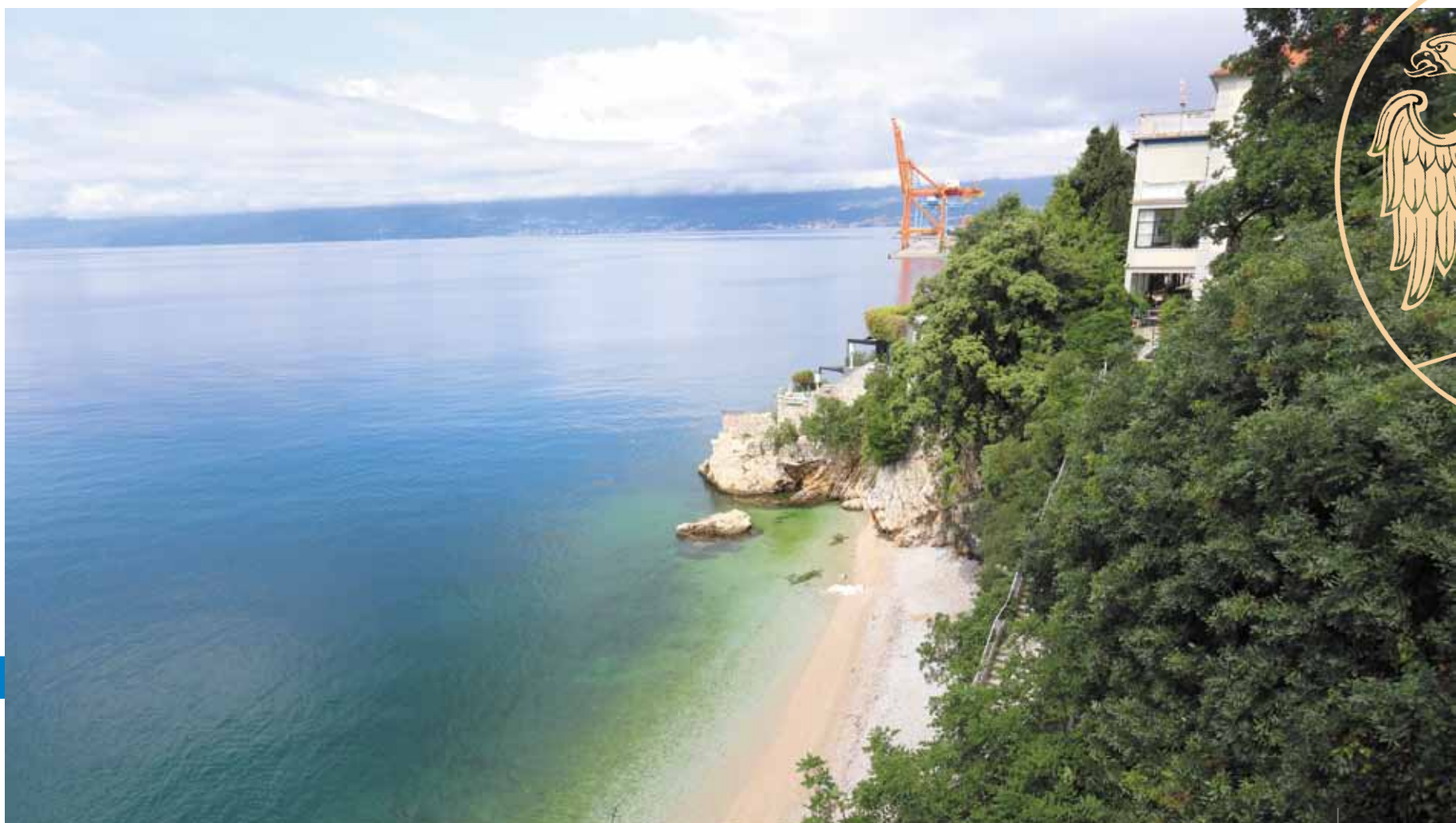
Il lido di Glavanovo