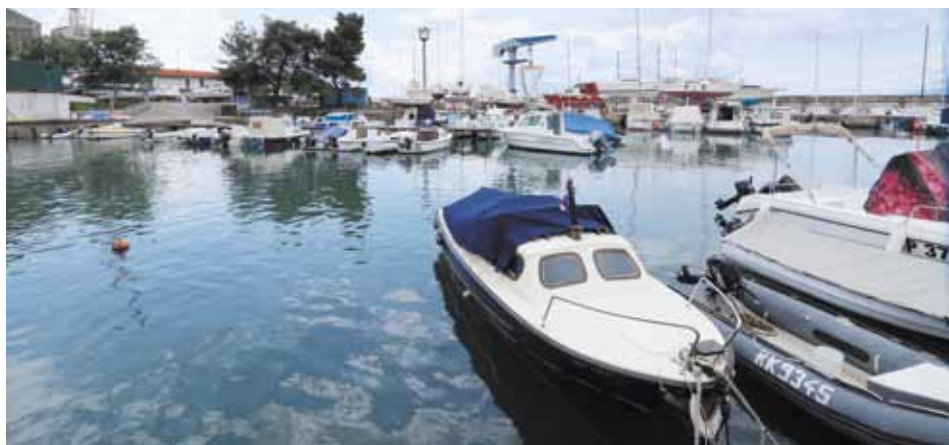
Il porticciolo del cantiere "3.maj"