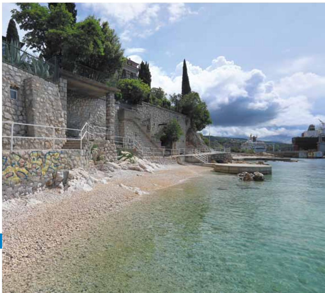
La spiaggia di Pećine

CENTRO ASTRONOMICICO – In occasione della Giornata degli asteroidi alle ore 19.30 verrà proposto lo show "I piccoli corpi del Sistema solare".