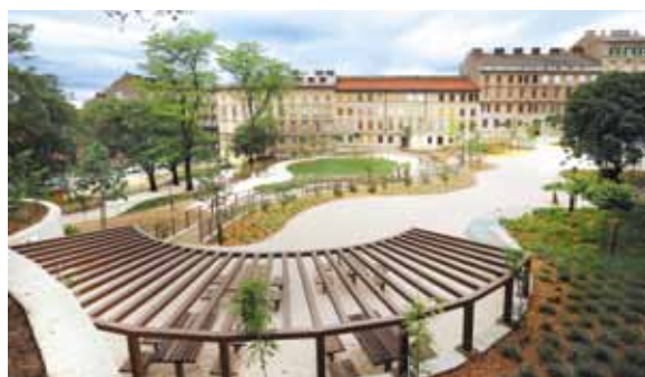
Una veduta del nuovo parco

costruita una nuova piazzola di sosta, dopo che è stata spostata la vecchia pensilina nell'area di attesa.