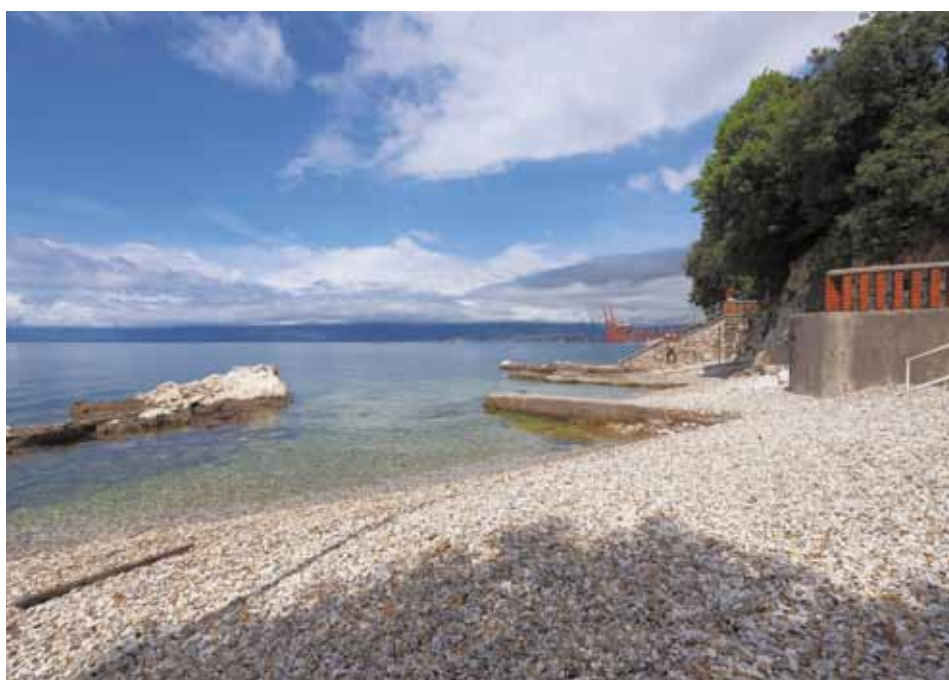
Una delle spiagge del rione di Pećine